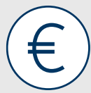
ABBILDUNG 4: KERNERGEBNISSE – MEHRUMSÄTZE DER PRIVATVERSICHERTEN IN BADEN-WÜRTTEMBERG