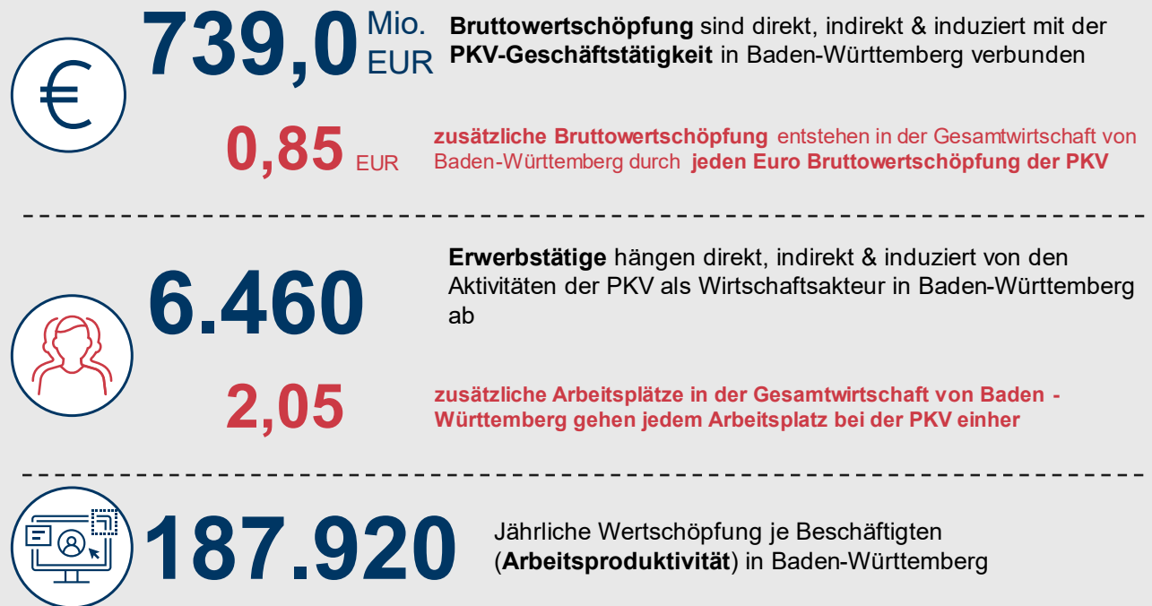
ABBILDUNG 2: KERNERGEBNISSE – PKV ALS WIRTSCHAFTSAKTEUR IN BADEN-WÜRTTEMBERG